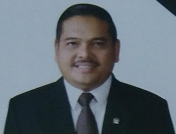
Rector Universitas Sari Mutiara Indonesia